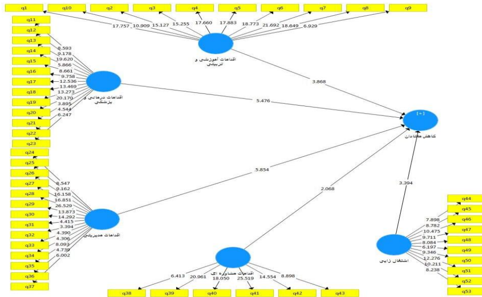
نمودار شماره ۳: مدل ساختاری پژوهش در حالت معناداری