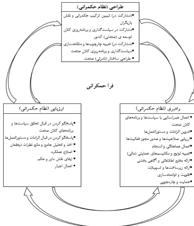
شکل شماره ۲: الگوی نهایی فرا حکمرانی صنعت پتروشیمی ایران بر اساس روش داده بنیاد ساخت‌گرا