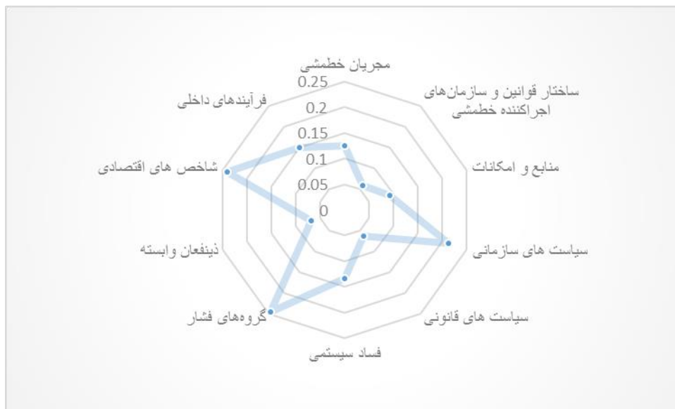
شکل شماره ۱: رتبه بندی شاخص‌های پژوهش