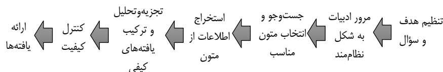
شکل شماره ۱: گام‌های متوالی روش فراترکیب

شناخته‌شده‌ترین الگوهای اجرای روش فراترکیب شامل الگوی سه‌مرحله‌ای نوبلت و هیر ۱ (۱۹۸۸)، الگوی شش‌مرحله‌ای والش و داوون ۲ (۲۰۰۵) و الگوی هفت مرحله‌ای سندلوسکی و باروسو ۳ (۲۰۰۷) است. در این پژوهش، الگوی سندلوسکی و باروسو (۲۰۰۷) به دلیل این که تاکنون در پژوهش‌های فراترکیب بیشترین استفاده را داشته است به کار گرفته شده است. مراحل روش فراترکیب در شکل ۱ نشان داده شده است.