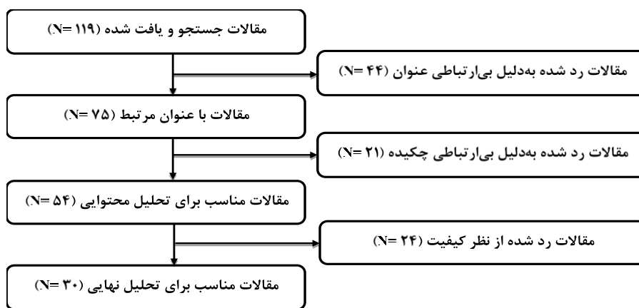
شکل ۲: نتایج جستجو و انتخاب متون