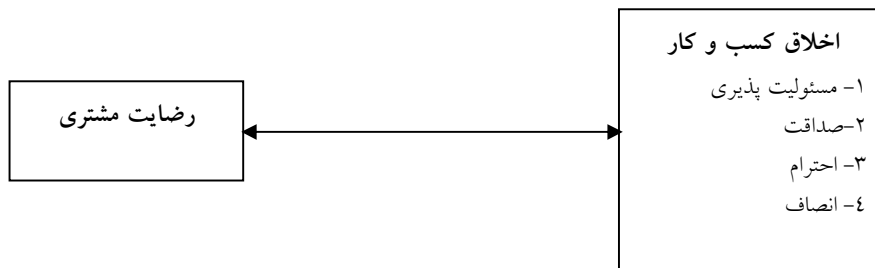
شکل ۲: مدل مفهومی پژوهش

رضاییان و همکاران (۱۳۹۱) به بررسی رابطه اخلاق کاری کارکنان بر رضایت مشتریان از کیفیت خدمات بانک، پرداختند. نتایج این پژوهش نشان داد که بین اخلاق کاری کارکنان و رضایت مشتریان از کیفیت خدمات بانک رابطه مثبت و معنی داری وجود دارد؛ به این معنا که با افزایش میزان اخلاقیات کار در کارکنان بانک، میزان رضایت مشتریان از کیفیت خدمات بانک افزایش می‌یابد.